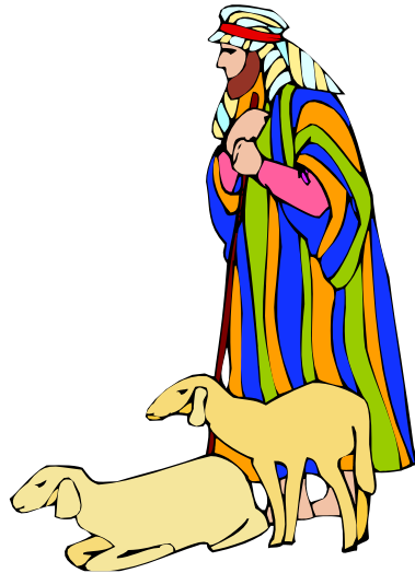
Pastore nomade come Abramo

Aveva quindi attraversato lentamente per anni le terre dei Sumeri , degli Accadi , dei Babilonesi , raccogliendo le leggende e le tradizioni di questi popoli , come quella del Diluvio e della famosa Torre di Babele , una delle tante Ziqqurat (torri-tempio) a più piani erette in ogni città su quelle terre per il culto delle divinità astrali, come il dio Sole (Shemesh, Marduk) e il Dio Luna (Sin).