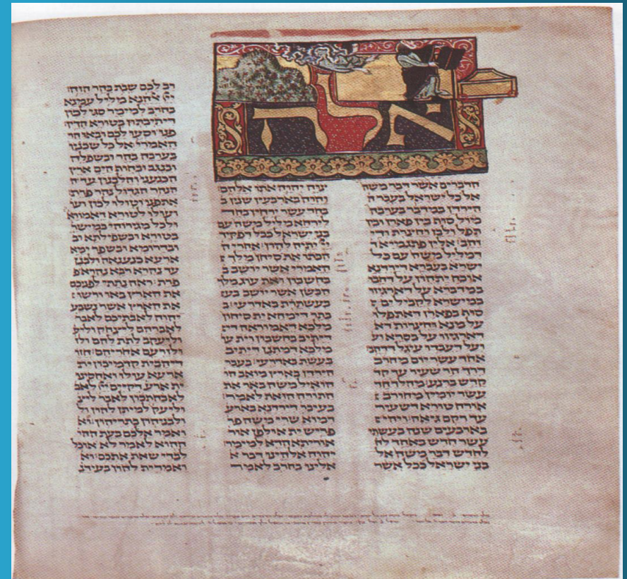
Tav. 1 Bibbia ebraica masoretica (XIII sec., pergamena), fol. 182v: Dt 1, 1-9, Biblioteca Ambrosiana, Milano (B 30 inf.), 25,8 x 18,8 cm.